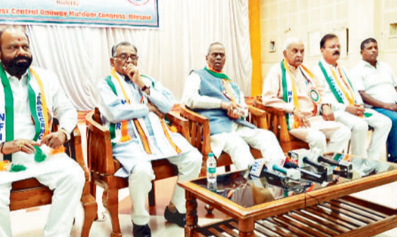
बैठक में चर्चा करते एनएफआईआर के पदाधिकारी।

नेशनल फेडरेशन आफ इंडिया रेलवे मेन के पदाधिकारियों का कहना है कि सरकार की नीतियों के तहत नई पेंशन स्कीम को लागू किया गया है, जिससे कर्मचारियों को कोई फायदा नहीं मिलेगा। इसके कारण सभी रेलवे में इसका पुरजोर विरोध करते हुए पुरानी पेंशन स्कीम को लागू करने की मांग हो रही है।